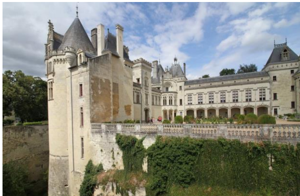
Château de Brézé