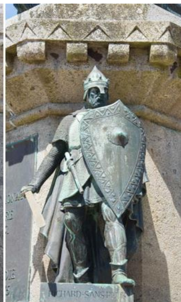
Richard 1 er

Les premiers ducs de Normandie sur le socle de la statue de Guillaume le Conquérant à Falaise