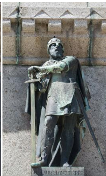
Guillaume Longue Epée