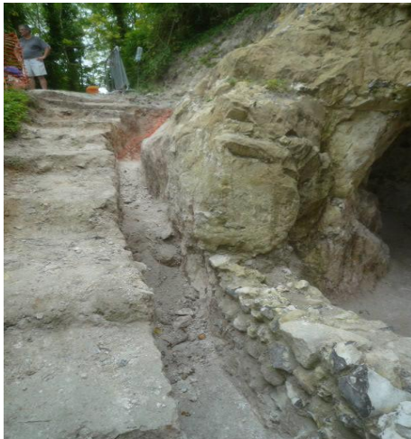
Ci-dessus le muret maçonné et ci-dessous l'un des graffitis mis à jour au pied de l'ouverture

La première confirme nos précédentes conclusions quant à la réalisation d'aménagements et de structures à des fins d'occupation de la grotte. La seconde que le site a bien été utilisé à certaines périodes pour l'exercice d'un culte votif.