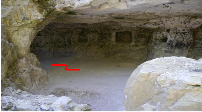
Aperçu du dénivelé (en rouge) entre les deux zones

Alors que nous acheminions sereinement vers la fin de notre exploration la dernière semaine nous a apportée son lot de découvertes.