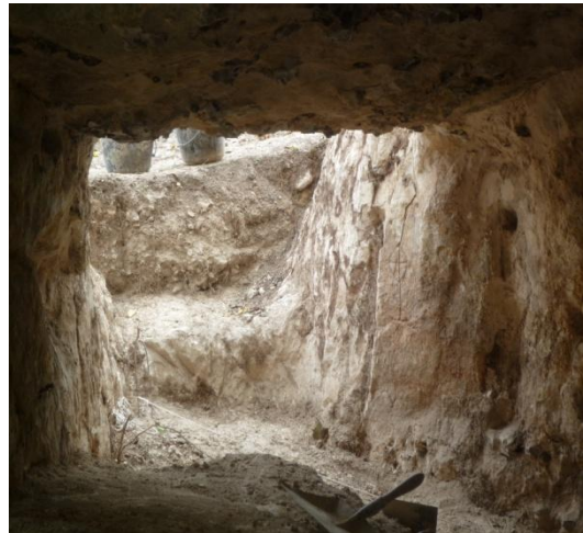
La nouvelle ouverture dégagée au sud-est de la cave