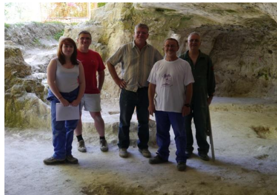
Les équipes qui ont réalisé les fouilles en Avril (à gauche) et Juillet (à droite)

Au terme de cette campagne de fouilles c'est avec regret mais aussi beaucoup de satisfaction que tous ceux qui ont participé à cette expérience depuis trois ans ont déposé les outils et quitté la Grotte du Sabotier. Nous disons encore merci à tous. L'aventure n'est malgré tout pas tout à fait terminée puisque dès septembre, lors des journées du patrimoine du 15 et 16 septembre, la grotte sera ouverte au public et des visites y seront organisées.