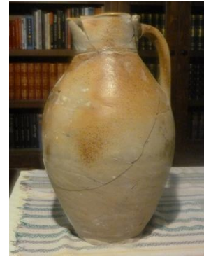
Poterie du XIVe siècle

Tandis que nous finissons de décaper le sol des dernières strates de couches calcaires nous mettons à jour deux fosses en T peu profondes et de formes similaires. Elles sont placées tête bêche parallèlement l'une de l'autre et à proximité de l'endroit où nous avons trouvé un bon nombre de gros ossements d'animaux dans la partie centrale de la grotte. Ces fosses font tout de suite penser à des fosses de dépeçage d'animaux. Mais cela reste à vérifier.