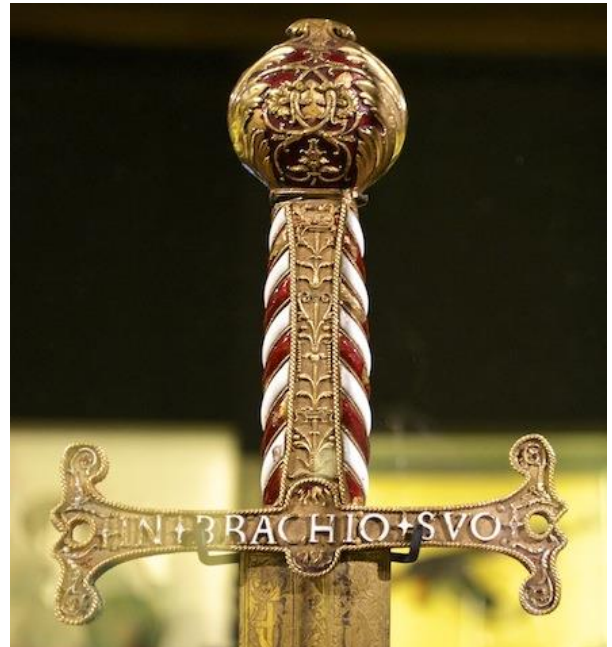
Epée de François Ier dite de « Pavie »

Puis viennent les épées de Cour dans de riches fourreaux mais elles restent des armes d'apparat que la noblesse exhibe. En Orient, l'arme reste le sabre, au Japon médiéval le katana.