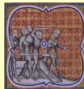
Guillaume longue épée comte de Normandie

Guillaume Longue-Épée devient comte de Normandie et épouse Liutgarde de Vermandois (la fille de Herbert II).