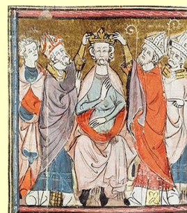
Raoul de Bourgogne

930 Au début de l'année, les Normands de la Loire envahissent de nouveau l'Aquitaine, pillent la Saintonge, l'Angoumois, le Périgord jusqu'en Limousin. Le roi Raoul intervient et bat les Normands à Estresse, près de Beaulieu-sur-Dordogne. Après cette campagne, les rois Francs n'interviendront plus au sud de la Loire