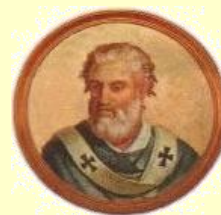
Le pape Etienne VII

928 Au carême le comte Herbert de Vermandois et le roi Raoul de Bourgogne se rencontrent. Herbert reçoit la ville de Laon abandonnée par la reine Emma et fait raser le château de Mortagne qui appartenait à Roger II de Laon et qui est maintenant totalement dépouillé de son comté. En mai le pape Jean X est incarcéré et assassiné. Léon VI lui succède mais il est également assassiné par Marozie 1 er (sénatrice et de patricienne de Rome). Ce n'est qu'en décembre que débute du pontificat d'Étienne VII.