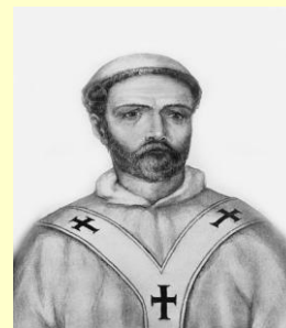
Le pape Jean XI

937 Louis IV (carolingien roides francs) renonce à la protection d'Hugues le Grand et se rend à Laon où il reçoit sa mère venue Angleterre. Après le départ du roi, Hugues fait la paix avec Herbert II de Vermandois, qui en profite pour reprendre Château-Thierry.