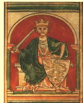
Guillaume Longue Epée

En décembre c'est l'assassinat du deuxième duc de Normandie, Guillaume I er Longue-Épée par les hommes du comte de Flandre Arnoul I er . Richard I er , également connu sous le nom de Richard sans peur, devient duc de Normandie. Il n'a que 10 ans. Louis IV, sous prétexte de faire son éducation, le fait transporter à Laon où il semble y avoir séjourné de 943 à 945.