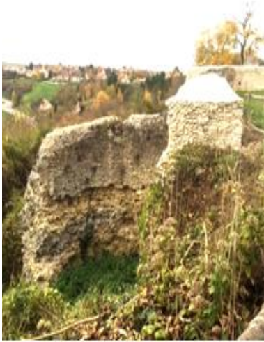
Érosion de la Tour flanquée