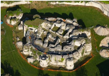
Plan du château en 1730 ; Vue aérienne de l'allée centrale et de la distribution des logis tels qu'ils subsistent aujourd'hui- Vue d'ensemble des logis

L'allée centrale traverse le site d'Ouest en Est en passant par le ravelin (barbacane) et les deux châtelets. Entièrement pavée, elle faisait office de cour du château et fonction de route bordée de part et d'autre de logis. Au XVI e siècle, une passerelle permettait d'enjamber cette « rue » pour passer d'une pièce à l'autre. Des logis, répartis en deux corps autour de l'allée centrale, il ne subsiste aujourd'hui que le premier niveau. Il compte sept pièces d'environ 15 à 20 mètres carrés. Sur les façades bordant la rue nous distinguons aisément l'embrasement d'une porte ou d'une fenêtre d'autant que certains de ces éléments ont été restaurés l'été dernier par une équipe de jeunes en réinsertion encadrée de compagnons tailleurs de pierre. Dans les murs de refends nous observons ici une cheminée, là un four à pain ou encore dans un recoin une latrine (toilette d'époque) ou un escalier desservant un niveau supérieur.