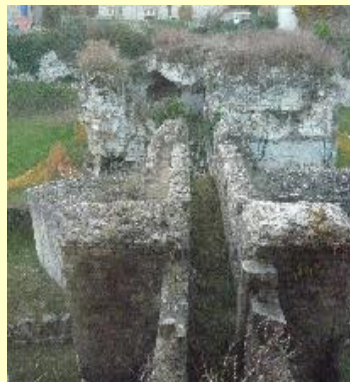
Le ravelin (barbacane)

Le second niveau permettait, lui, de relier directement le Châtelet Ouest à la terrasse supérieure du ravelin et de rejoindre ensuite le sommet de la contrescarpe du côté de l'ancienne basse-cour.