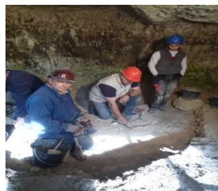
Décapage d'un niveau de fouille